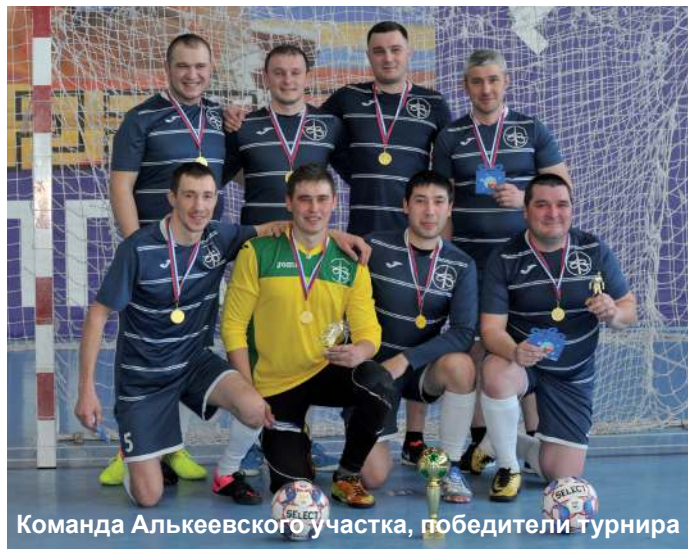
Команда Алькеевского участка, победители турнира

Во втором полуфинале встречались команда Спасского участка – фаворит этого турнира и андердог, команда ООО «Мостовик».